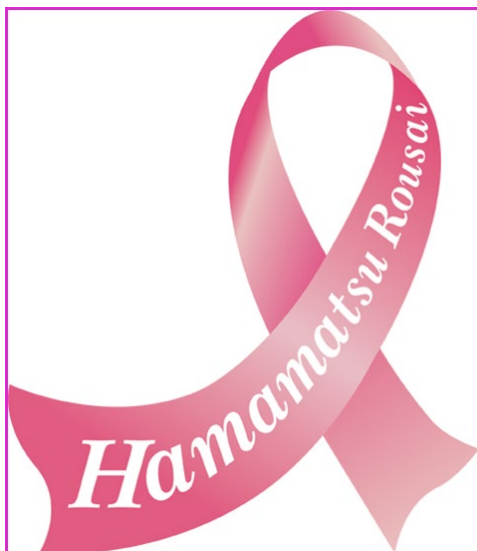
(図2) 当院放射線科のオリジナルピンクリボンデザイン