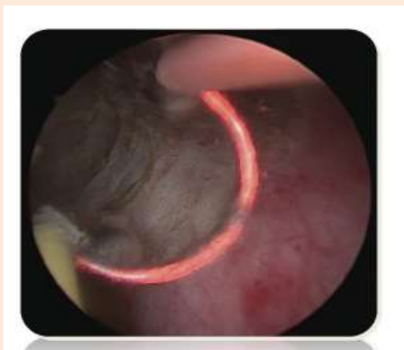
(写真2) 確実かつ迅速なプラズマ形成