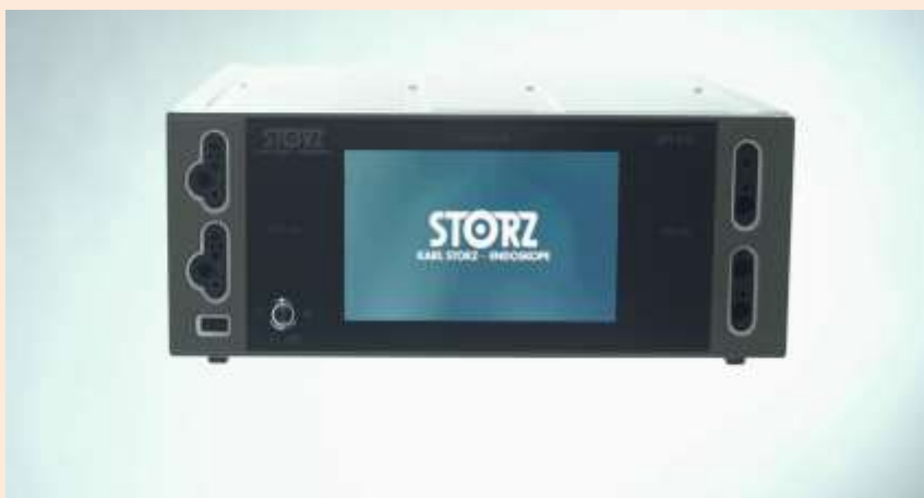
(写真1) AUTOCON III 400