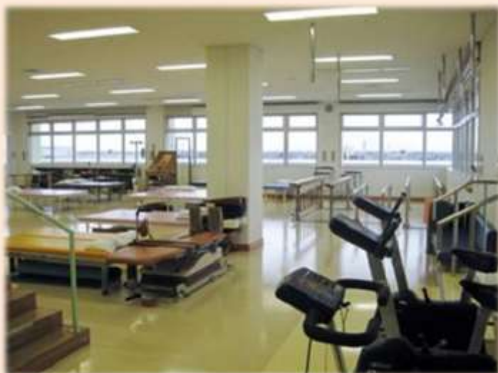
中央リハビリテーション部内の風景です。