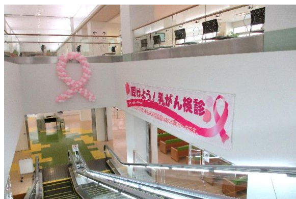
ピンクリボン運動のデコレーション

地域の皆様からの信頼に応え続けるために「アットホームなハイクラスの病院」を理念に取り組んでいます。