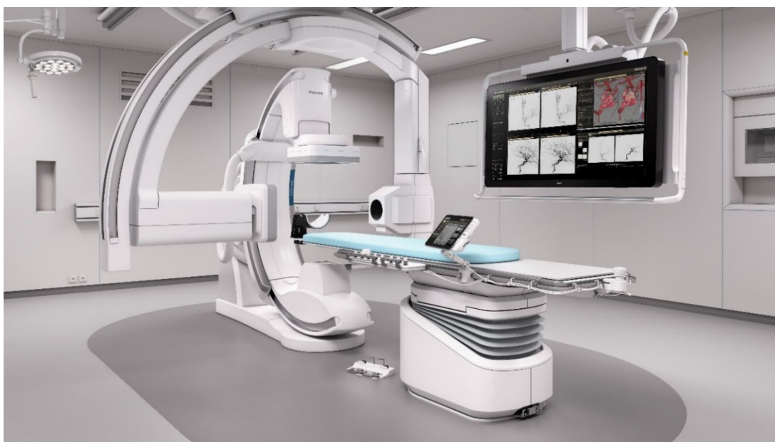
図 1 Philips 社製 Azurion7 B20/15

これらの技術を用いて、患者様の X 線被ばくを最小限に抑えながら、複雑かつ高度な血管内治療、画像下治療を提供できる体制を整えております。