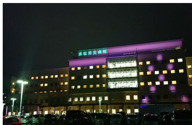
(ピンクリボンライトアップ風景)

地域の皆様からの信頼に応え続けるために「アットホームなハイクラスの病院」を理念に取り組んでいます。