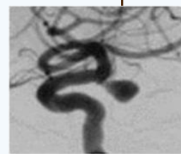
脳動脈瘤 コイル塞栓術